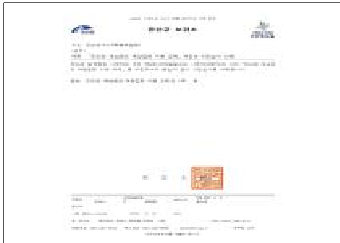
조례안 사전심사 의뢰