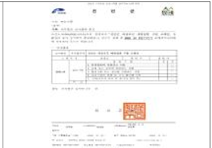
조례 사전심사 결과 회신