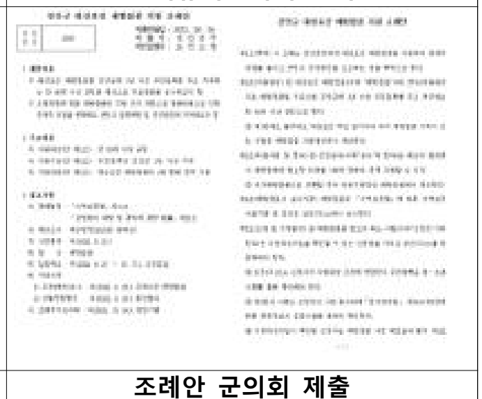
조례안 군의회 제출